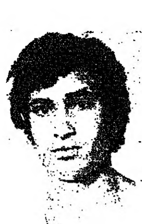
حملي عودة حمي المرمى